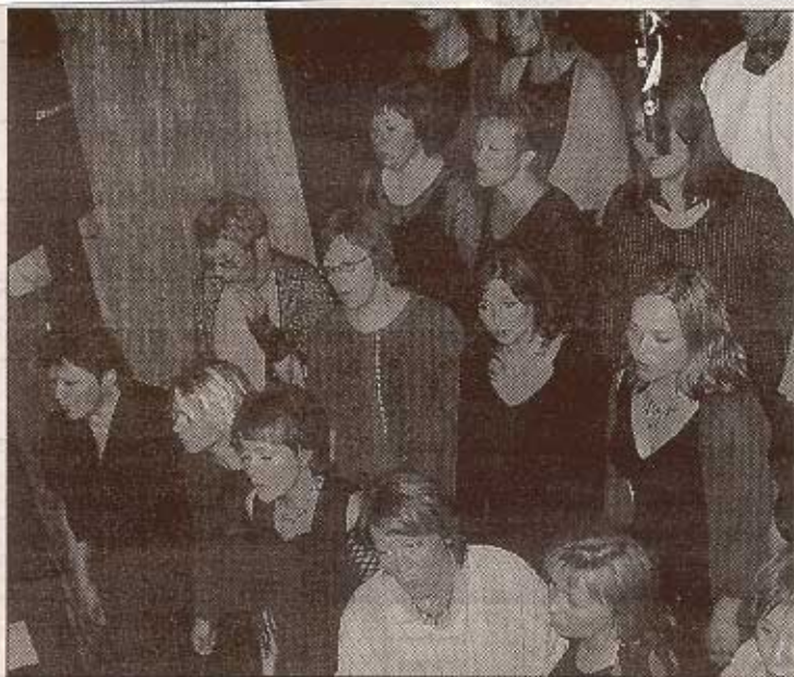
PRESIST Sangkoret Mollis imponerte igjen med sin konsert «Mandelträd och marmor».